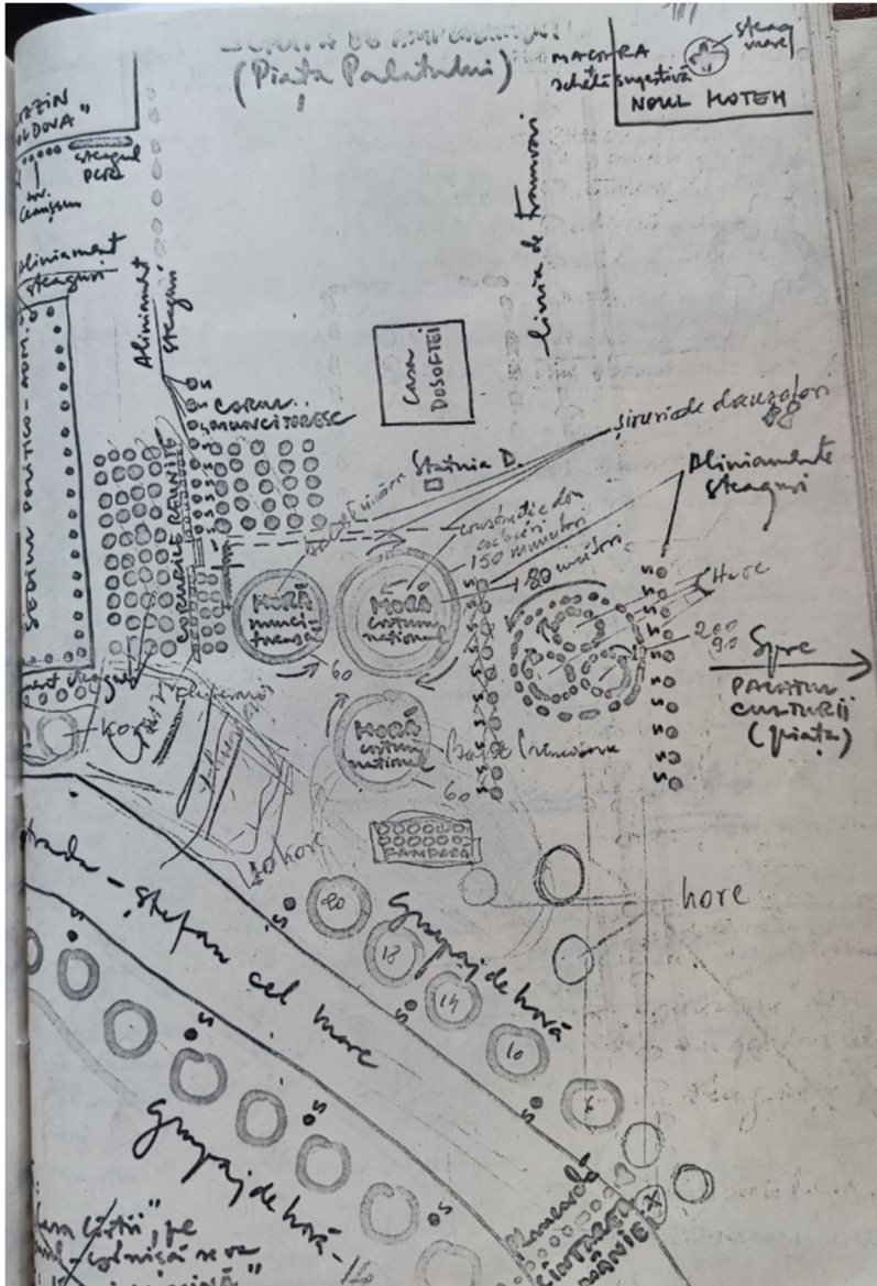
Vizita tovarășului Nicolae Ceaușescu la Iași 15 septembrie 1980.